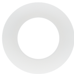
Anel de cobertura PD9 Ø 36 mm Número: 92238

Dimensões: Ø 36 mm Involucro: Policarbonato resistente aos raios UV Cor do material: antracite brilho