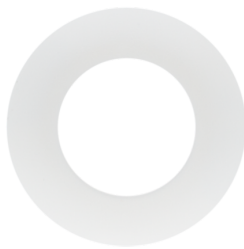
Anel de cobertura PD9 Ø 36 mm Número: 92238

Dimensões: Ø 36 mm Involucro: Policarbonato resistente aos raios UV Cor do material: antracite brilho