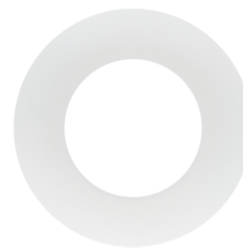
Anel de cobertura PD9 Ø 36 mm Número: 92238

Grau de proteção / Classe de Isolamento: IP65 Involucro: resistente aos raios UV Cor do material: transparente