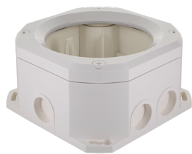
Conjunto de montagem de superfície SM IP65 PD4N Número: 93314

Tensão: 230 V AC \pm 10\% 50 Hz Dimensões: \varnothing 106 x 95 mm Alimentação: aprox. 2 W