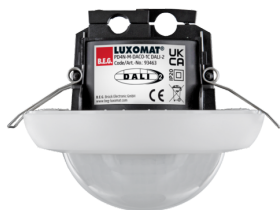
PD4N-M-DACO-1C DALI-2 Número: 93463

Para obter o conjunto de acordo com as especificações técnicas, é necessário encomendar os artigos indicados.