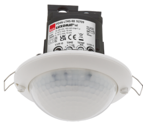
PD4N-LTMS-RR-FC Número: 92709

Para obter o conjunto de acordo com as especificações técnicas, é necessário encomendar os artigos indicados.