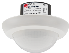
PD4N-1C-FM Número: 92151

Para obter o conjunto de acordo com as especificações técnicas, é necessário encomendar os artigos indicados.