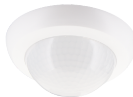
lens PD4N-1C, Anel de cobertura Número: 93737

Dimensões: Ø 200 x 90 mm Resistência ao choque: IK09 Invólucro: cesta de aço revestida