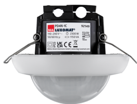
PD4N-1C-FC Número: 92149

Para obter o conjunto de acordo com as especificações técnicas, é necessário encomendar os artigos indicados.