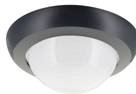
lens PD4N-1C, Anel de cobertura Número: 93736

Dimensões: Ø 200 x 90 mm Resistência ao choque: IK09 Involucro: cesta de aço revestida