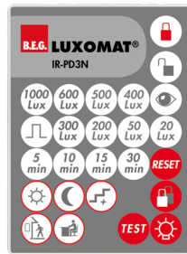
IR-PD3N Número: 92105

Dimensões: 47 x 19 x 10 mm Grau de proteção / Classe de Isolamento: IP20 Temperatura ambiente: -20 °C até +40 °C