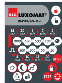
IR-PD3/4N-1C-E Número: 93110

Bateria: 3.0 V lítio CR2032 (incluída) Dimensões: 80 x 60 x 8 mm Cor do material: -