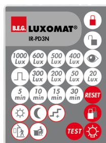
IR-PD3N Número: 92105

Dimensões: 47 x 19 x 10 mm Grau de proteção / Classe de Isolamento: IP20 Temperatura ambiente: -20 °C até +40 °C