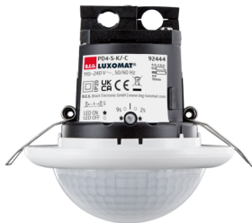
PD4-S-C-FC Número: 92444

Para obter o conjunto de acordo com as especificações técnicas, é necessário encomendar os artigos indicados.