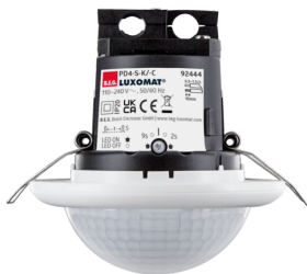
PD4-S-C-FC Número: 92444

Para obter o conjunto de acordo com as especificações técnicas, é necessário encomendar os artigos indicados.