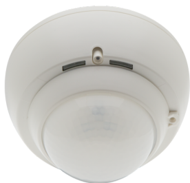
PD4-M-HCL2-SM DALI-2 Número: 93485

Para obter o conjunto de acordo com as especificações técnicas, é necessário encomendar os artigos indicados.