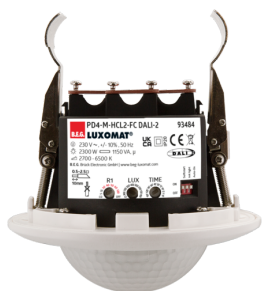
PD4-M-HCL2-FC DALI-2 Número: 93484

Para obter o conjunto de acordo com as especificações técnicas, é necessário encomendar os artigos indicados.