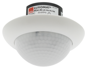
PD4-M-2C-FM Número: 92255

Para obter o conjunto de acordo com as especificações técnicas, é necessário encomendar os artigos indicados.