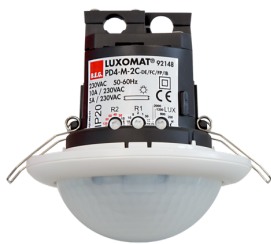
PD4-M-2C-FC Número: 92148

Para obter o conjunto de acordo com as especificações técnicas, é necessário encomendar os artigos indicados.