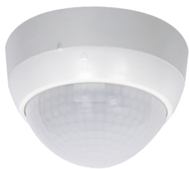
PD4-M-1C-SM Número: 92580

Para obter o conjunto de acordo com as especificações técnicas, é necessário encomendar os artigos indicados.