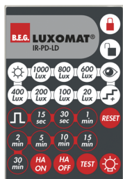
IR-PD-LD Número: 92479

Dimensões: 40 x 55 x 103 mm Cor do material: Preto Frequência: 2.4 GHz Banda ISM , GFSK 0.2 dBm + 5.3 dBi = 5.5 dBm