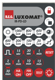
IR-PD-LD Número: 92479

Dimensões: 40 x 55 x 103 mm Cor do material: Preto Frequência: 2.4 GHz Banda ISM , GFSK 0.2 dBm + 5.3 dBi = 5.5 dBm