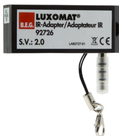
Adaptador IV para smartphones Número: 92726

Bateria: 3 x 1.5 V Micro AAA (não incluído) Dimensões: 83 x 53 x 17 mm Cor do material: -