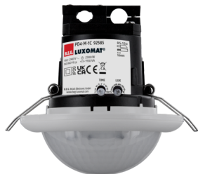
PD4-M-1C-FC Número: 92585

Para obter o conjunto de acordo com as especificações técnicas, é necessário encomendar os artigos indicados.