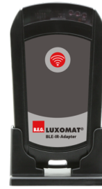
BLE-IV-Adaptador Número: 93067

Tensão: 230 V AC ±10% Dimensões: 50 x 23 x 8 mm Grau de proteção / Classe de Isolamento: IP20 / Classe II