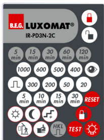
IR-PD3N-2C Número: 92115

Dimensões: 40 x 55 x 103 mm Cor do material: Preto Frequência: 2.4 GHz Banda ISM , GFSK 0.2 dBm + 5.3 dBi = 5.5 dBm