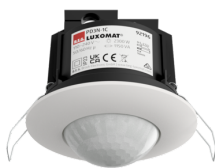
PD3N-1C-FC Número: 92196

Para obter o conjunto de acordo com as especificações técnicas, é necessário encomendar os artigos indicados.