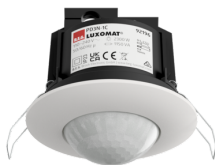
PD3N-1C-FC Número: 92196

Para obter o conjunto de acordo com as especificações técnicas, é necessário encomendar os artigos indicados.