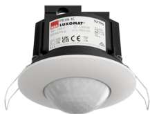
PD3N-1C-FC Número: 92196

Para obter o conjunto de acordo com as especificações técnicas, é necessário encomendar os artigos indicados.