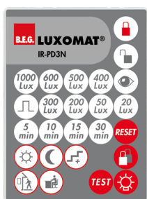
IR-PD3N Número: 92105

Dimensões: 40 x 55 x 103 mm Cor do material: Preto Frequência: 2.4 GHz Banda ISM , GFSK 0.2 dBm + 5.3 dBi = 5.5 dBm