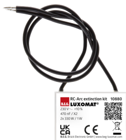
Kit RC supressor de arco elétrico Número: 10880

Tensão: 230 V AC ±10% Dimensões: 38 x 12 x 26 mm Grau de proteção / Classe de Isolamento: IP20 / Classe II