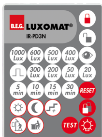
IR-PD3N Número: 92105

Dimensões: 40 x 55 x 103 mm Cor do material: Preto Frequência: 2.4 GHz Banda ISM , GFSK 0.2 dBm + 5.3 dBi = 5.5 dBm