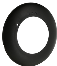
Anel de cobertura PD2N FC Número: 93773

Tensão: 230 V AC \pm 10\% 50 Hz Dimensões: \varnothing 84 x 85 mm Alimentação: aprox. 2 W