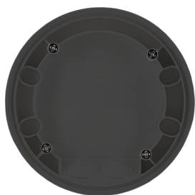
Conjunto de montagem de superfície SM IP54 PD2N- / PD4N-FM Número: 93751

Tensão: através do bus KNX Dimensões: Ø 106 x 42 mm Consumo de corrente: 12 mA