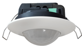
PD2N-DALI-SYS-FC Número: 93369

Para obter o conjunto de acordo com as especificações técnicas, é necessário encomendar os artigos indicados.