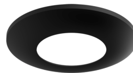
Anel de cobertura PD2/PD3 FC Número: 93085

Dimensões: Ø 200 x 90 mm Resistência ao choque: IK09 Involucro: cesta de aço revestida