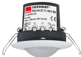
PD2-M-2C-12-48V-RR-FC Número: 92306

Para obter o conjunto de acordo com as especificações técnicas, é necessário encomendar os artigos indicados.