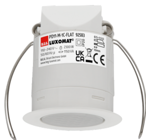
PD11-M-1C-FLAT-FC Número: 92583

Para obter o conjunto de acordo com as especificações técnicas, é necessário encomendar os artigos indicados.