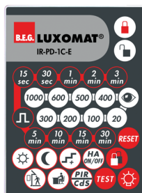
IR-PD-1C-E Número: 92077

Bateria: 3.0 V lítio CR2032 (incluída) Dimensões: 80 x 60 x 8 mm Cor do material: -