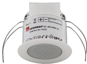
PD11-KNXs-FLAT-ST-FC Número: 93522

Para obter o conjunto de acordo com as especificações técnicas, é necessário encomendar os artigos indicados.