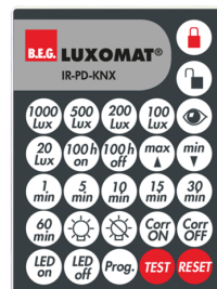
IR-PD-KNX Número: 92123

Dimensões: Ø 52 x 3 mm Involucro: Policarbonato resistente aos raios UV Cor do material: Preto, semelhante RAL9005