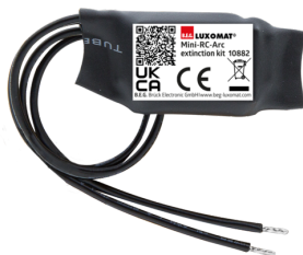
Mini kit RC supressor de arco elétrico Número: 10882

Tensão: 230 V AC ±10% Dimensões: 38 x 12 x 26 mm Grau de proteção / Classe de Isolamento: IP20 / Classe II