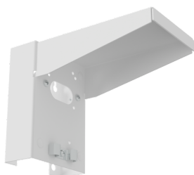
Montagem em parede - Proteção contra elementos meteorológicos Número: 93222

Dimensões: 188 x 98 x 134 mm Involucro: aço inoxidável Cor do material: aço inoxidável