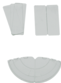
Máscaras LC-Click-N Número: 32699

Dimensões: 188 x 98 x 134 mm Cor do material: antracite