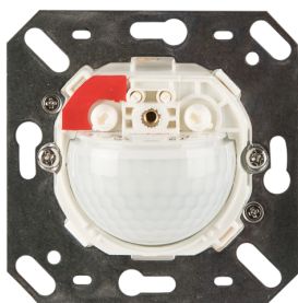
Indoor 180-M-2C sem moldura Número: 92661

Para obter o conjunto de acordo com as especificações técnicas, é necessário encomendar os artigos indicados.