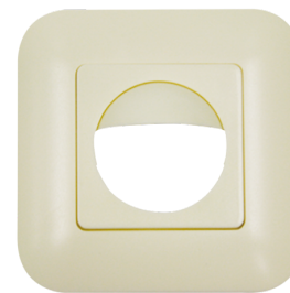
Moldura IP20 Indoor 180 Número: 92632

Dimensões: 87 x 87 mm Grau de proteção / Classe de Isolamento: IP54 Involucro: Policarbonato resistente aos raios UV