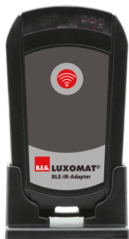
BLE-IV-Adaptador Número: 93067

Dimensões: 40 x 55 x 103 mm Cor do material: Preto Frequência: 2.4 GHz Banda ISM , GFSK 0.2 dBm + 5.3 dBi = 5.5 dBm