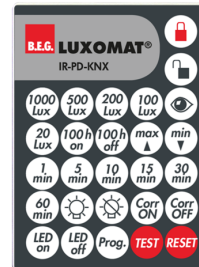
IR-PD-KNX Número: 92123

Dimensões: 47 x 19 x 10 mm Grau de proteção / Classe de Isolamento: IP20 Temperatura ambiente: -20 °C até +40 °C