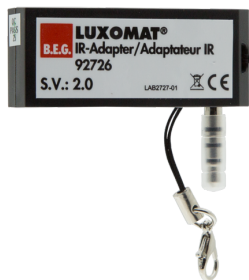
Adaptador IV para smartphones Número: 92726

Dimensões: 40 x 55 x 103 mm Cor do material: Preto Frequência: 2.4 GHz Banda ISM , GFSK 0.2 dBm + 5.3 dBi = 5.5 dBm