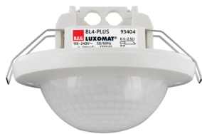
BL4-PLUS-FC Número: 93404

Para obter o conjunto de acordo com as especificações técnicas, é necessário encomendar os artigos indicados.