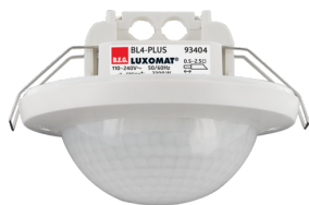
BL4-PLUS-FC Número: 93404

Para obter o conjunto de acordo com as especificações técnicas, é necessário encomendar os artigos indicados.