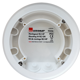
Kit de montagem BL2-SM Número: 93256

Tensão: 110 - 240 V 50 / 60 Hz Dimensões: Ø 80 x 61 mm Alimentação: 0.3 W