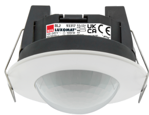
BL2-FC Número: 93317

Para obter o conjunto de acordo com as especificações técnicas, é necessário encomendar os artigos indicados.