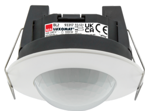
BL2-FC Número: 93317

Para obter o conjunto de acordo com as especificações técnicas, é necessário encomendar os artigos indicados.