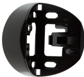
Zewnętrzna podstawka do montażu narożnego RC-plus next Nr art.: 97024

Wymiary: Ø 164 x 143 mm Klasa ochrony mechanicznej: IK09 Obudowa: Osłona druciana