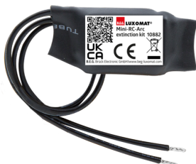
Mini-Zestaw do przerywania łuku RC Nr art.: 10882

Napięcie: 230 V AC ±10% Wymiary: 38 x 12 x 26 mm Stopień / Klasa ochrony: IP20 / Klasa II