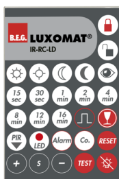
IR-RC-LD Nr art.: 92649

Bateria: 3.0 V Bateria litowa CR2032 (w zestawie) Wymiary: 80 x 60 x 8 mm Kolor materiału: -