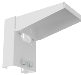
Wspornik ścienny - Ochrona przed warunkami atmosferycznymi Nr art.: 93222

Wymiary: 188 x 98 x 134 mm Obudowa: Stal nierdzewna Kolor materiału: Stal nierdzewna