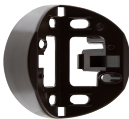
Zewnętrzna podstawka do montażu narożnego RC-plus next Nr art.: 97014

Wymiary: Ø 164 x 143 mm Klasa ochrony mechanicznej: IK09 Obudowa: Ośłona druciana