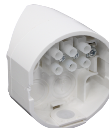
Wewnętrzna podstawka do montażu narożnego RC-plus next Nr art.: 97005

Wymiary: Ø 71 x 34 mm Stopień / Klasa ochrony: IP54 Obudowa: poliwęglan, odporny na promieniowanie UV