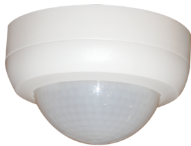
PD4N-1C-SM Nr art.: 92144

Aby otrzymać zestaw zgodnie ze specyfikacją techniczną, proszę zamówić wymienione produkty.