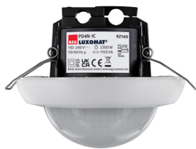
PD4N-1C-FC Nr art.: 92149

Aby otrzymać zestaw zgodnie ze specyfikacją techniczną, proszę zamówić wymienione produkty.