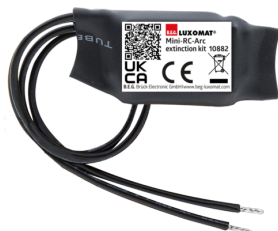
Mini-Zestaw do przerywania łuku RC

Napięcie: 230 V AC ±10% Wymiary: 38 x 12 x 26 mm Stopień / Klasa ochrony: IP20 / Klasa II