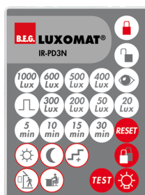
IR-PD3N Nr art.: 92105

Wymiary: 47 x 19 x 10 mm Stopień / Klasa ochrony: IP20 Temperatura otoczenia: -20 °C (do) +40 °C