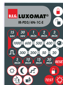
IR-PD3/4N-1C-E Nr art.: 93110

Bateria: 3.0 V Bateria litowa CR2032 (w zestawie) Wymiary: 80 x 60 x 8 mm Kolor materiału: -