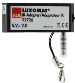
Adapter IR do smartfonów Nr art.: 92726

Wymiary: 40 x 55 x 103 mm Kolor materiału: czarny Częstotliwość: 2.4 GHz pasmo ISM, GFSK 0.2 dBm + 5.3 dBi = 5.5 dBm