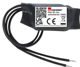
Mini-Zestaw do przerywania łuku RC Nr art.: 10882

Napięcie: 230 V AC \pm 10\% Wymiary: 38 x 12 x 26 mm Stopień / Klasa ochrony: IP20 / Klasa II