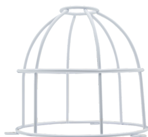
Ośłona druciana BSK ( \varnothing 164 \times 143 mm) Nr art.: 92467

Napięcie: 230 V AC \pm 10\% 50 Hz Wymiary: \varnothing 117 \times 100 mm Pobór energii: około 2 W