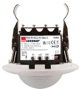
PD4-M-HCL2-FC DALI-2 Nr art.: 93484

Aby otrzymać zestaw zgodnie ze specyfikacją techniczną, proszę zamówić wymienione produkty.