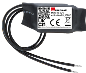
Mini-Zestaw do przerywania łuku RC Nr art.: 10882

Napięcie: 230 V AC ±10% Wymiary: 38 x 12 x 26 mm Stopień / Klasa ochrony: IP20 / Klasa II