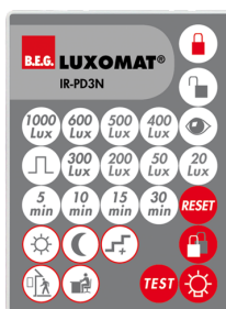
IR-PD3N Nr art.: 92105

Bateria: 3.0 V Bateria litowa CR2032 (w zestawie) Wymiary: 80 x 60 x 8 mm Kolor materiału: -